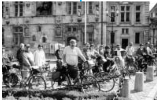
Le raid 2002 devant la mairie de Compiègne

En mai 2001, j'ai eu le plaisir de participer une taping du raid de la Transeuropéenne dans Paris depuis le bassin de la Villette jusqu'au cœur de Paris. Symboliquement, sur le parvis de Notre-Dame, j'avais inauguré des panneaux indiquant les directions de Trondheim, Moscou et Saint Jacques de