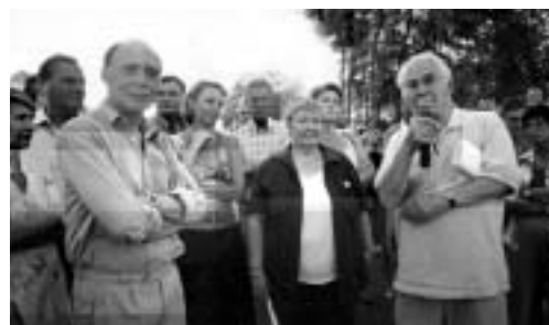
La Rando 2003 participe à l'inauguration officielle d'un tronçon de la Loire à Vélo