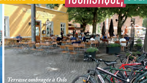
Terrasse ombragée à Oslo