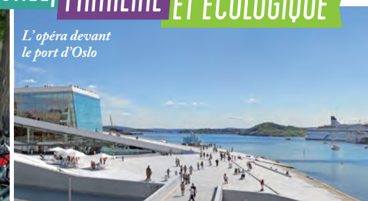
L'opéra devant le port d'Oslo