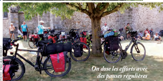
On dose les efforts avec des pauses régulières