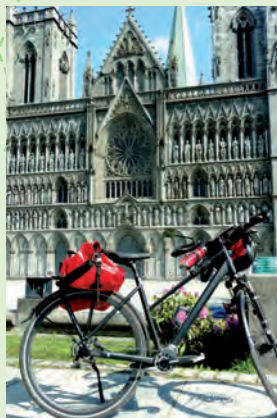
Trondheim, l'aventure commence devant la cathédrale Nidaros