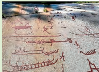
Gravures rupestres de Tanum