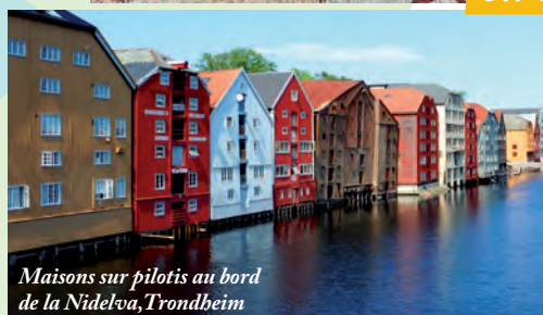
Maisons sur pilotis au bord de la Nidelva, Trondheim