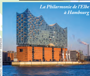
La Philharmonie de l'Elbe à Hambourg