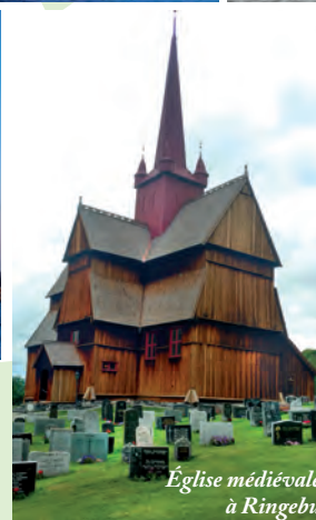
Église médiévale à Ringebu

Les photos de ce dépliant ont été prises par François, Carine et Kai lors de leur reconnaissance.